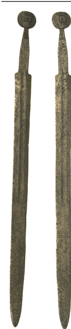
Ил. 1. Меч, инв.№ 0106/126 (общий вид)

Данное оружие представляет собой следующее (ил. 1). Стальной обоюдоострый клинок, длиной 728 мм. Его лезвия идут почти параллельно друг другу почти по всей длине. Поэтому ширина клинка у плечиков составляет 52 мм, в середине – 47 мм, а ближе к острию – 40 мм. Лезвия начинают плавно сужаться только в нескольких сантиметрах от окончания, образуя острие. На каждой стороне по центру проходит один дол, начинающийся еще на хвостовике и занимающий верхнюю половину клинка. Его длина 370 мм. Сечение боевой части одинаковое – в виде уплощенной линзы. Подобный клинок, скорее всего, был полифункциональным, одинаково пригодным и для рубящего удара, и для укола. В долах сохранились только следы клеймения. На одной стороне, примерно в середине, прослеживается клеймо в виде небольших черточек-канавок, контур которых, отдаленно напоминает бегущего зверя, вероятно волка (ил. 2b). На другой стороне, ближе к плечикам клинка и у завершения дола, такого рода черточки образуют контуры двух клейм в виде большого четырехконечного латинского креста на возвышении по центру и двух малых крестов, расположенных по бокам (ил. 2a). Все эти канавки указывают на то, что первоначально клейма были более четкими за счет их тауширования каким-либо из цветных металлов.